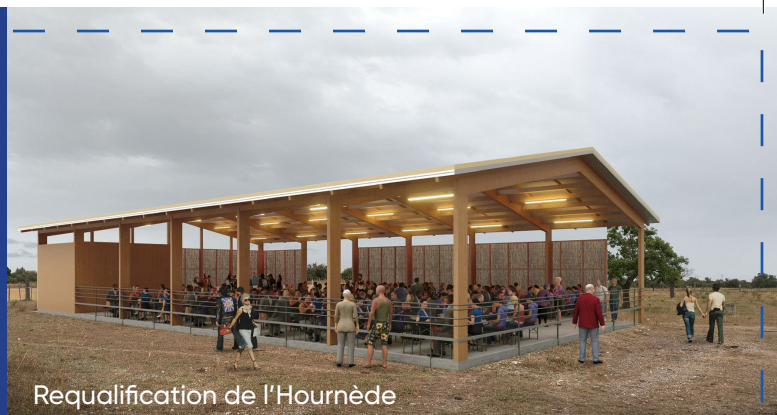
Requalification de l'Hournède

Des agents reconnus pour une administration performante, orientée usager et proximité. Formation et revalorisation des agents fondées sur la manière de servir, implication collective et maîtrise rigoureuse des moyens. Tarifs municipaux adaptés aux besoins sociaux. Maintenir et poursuivre une gestion saine et rigoureuse.