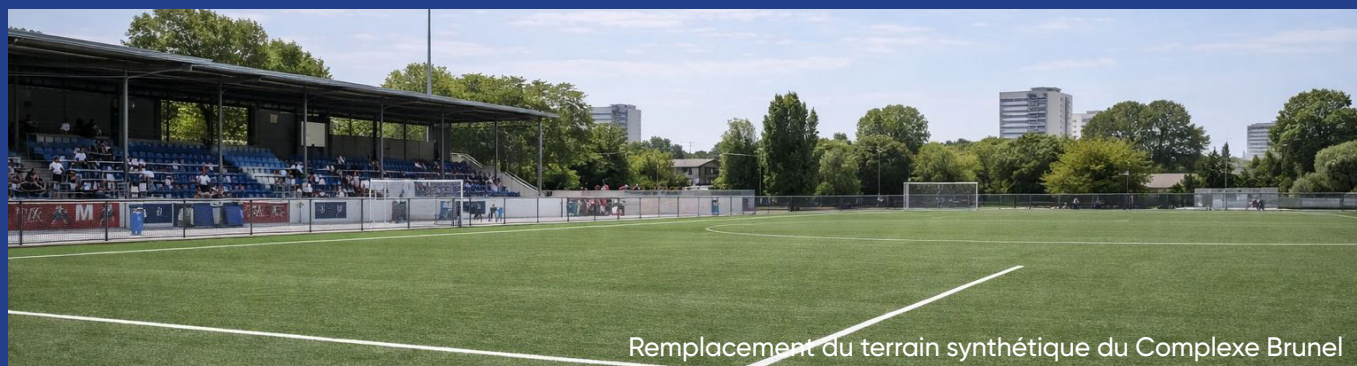
Remplacement du terrain synthétique du Complexe Brunel

Renforcement de la propreté urbaine et de l'entretien des espaces publics. Meilleure gestion des déchets et lutte contre les dépôts sauvages. Mise en place d'un plan d'action « Chiens-Chats » avec les associations de protection animale et création d'un espace végétalisé dédié aux chiens pour une ville amie des animaux.